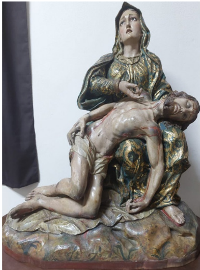
Figura III. N. Sra. da Piedade