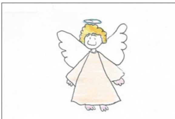
Figura 1. Anjo

CATEGORIA 1: Enfermeira se autoconhecendo para cuidar do outro – se perspectiva em prol da necessidade do outro