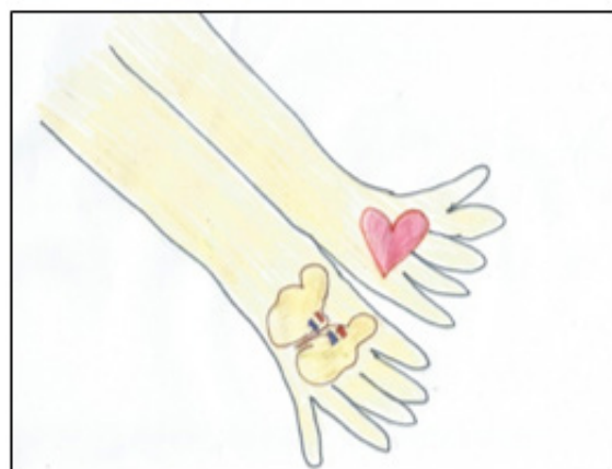
Figura 3. A confiança

CATEGORIA 3: O Enfermeiro conhece o outro cientificamente – identifica influentes para elaborar intervenções