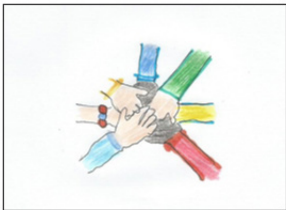
Figura 4. O Apoio

CATEGORIA 4: O Enfermeiro transforma sua experiência em conhecimento para muitos por meio do nexos paradoxal – analisa e aponta estratégias