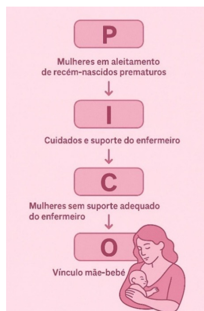
Figura 1. Aplicação da estratégia PICO.

A estratégia pico aborda: Paciente/População (P), Intervenção (I), Comparação (C) e Desfecho (O) e pôr fim a formação da pergunta, onde será guiado o princípio da construção da pesquisa e busca para que a seleção dos artigos se enquadre em tal questionamento. A aplicação da estratégia PICO, pode ser vista na figura 1.